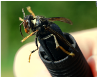
la pince Robor